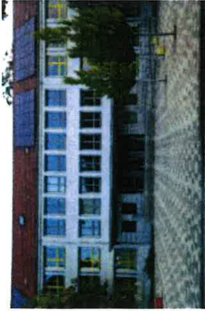
das „Brecht“ mit neuer Fassade sowie Wärme- und Sonnenschutz

Liebe Schülerinnen und Schüler, sehr geehrte Eltern,