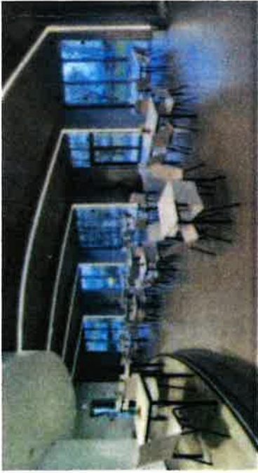
neue Mensa von innen